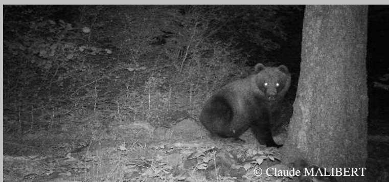
Photo d'ours indéterminé (Cannellito probable), transmise par GSM, le 02 Août 2013 à 22h13, commune de Luz St Sauveur (65)